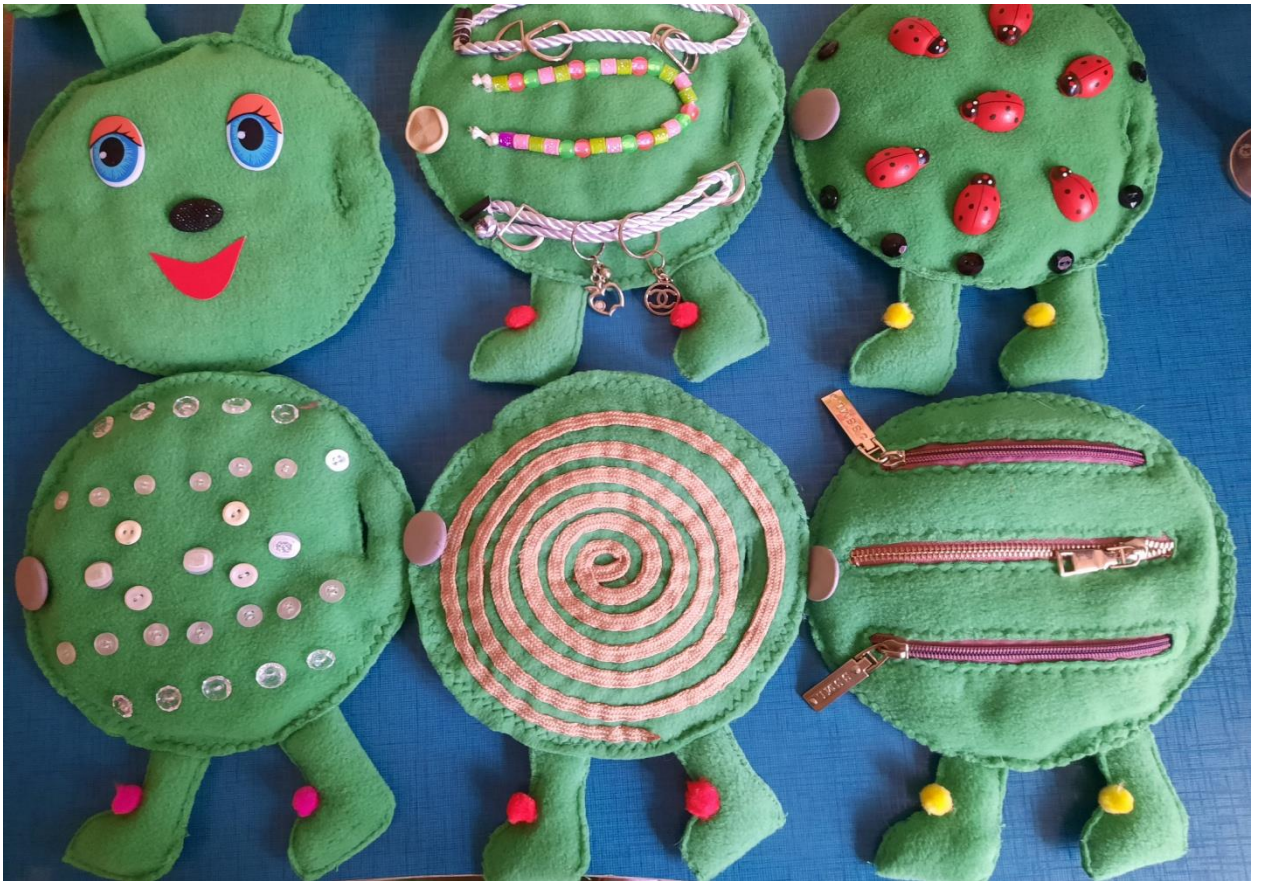
Собираем гусеницу в любой очередности.